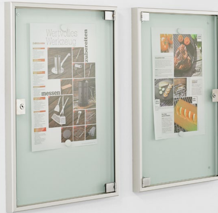
► Plakatvitrine Typ PV